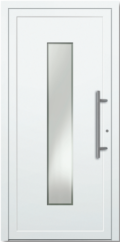
Modell: D 100