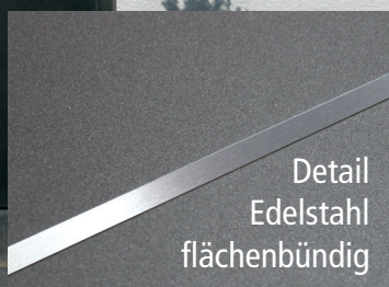
Modell: D 501

Telefon: 0 52 07 / 72 08 Mail: info@dalkmann.gmbh www.dalkmann.gmbh