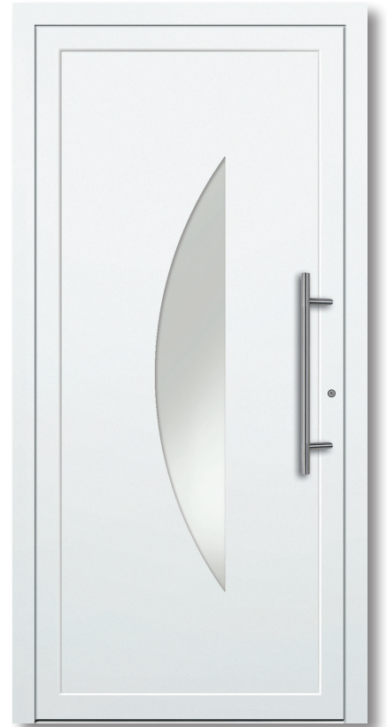
Modell: D 300