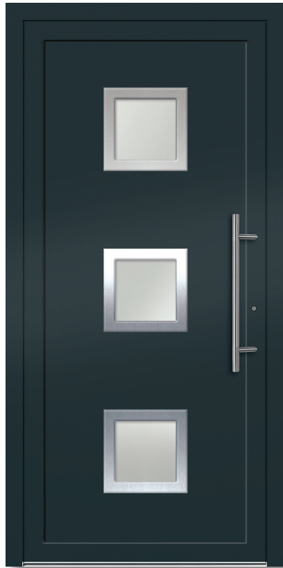
Modell: D 202