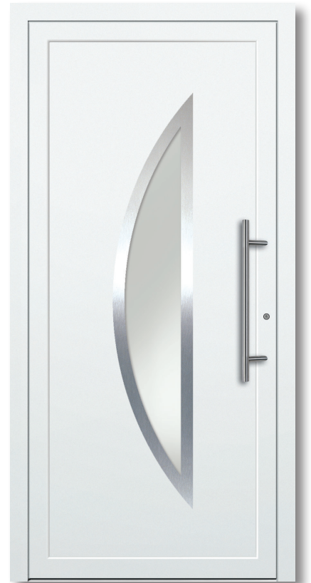
Modell: D 302