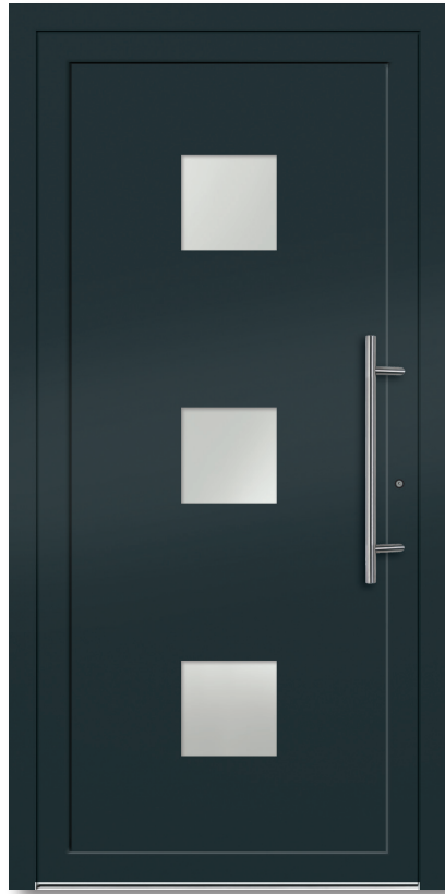
Modell: D 200