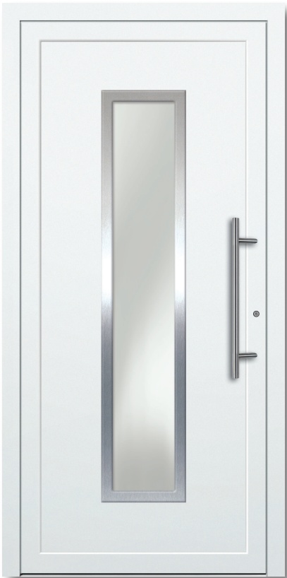
Modell: D 102